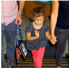
APPUI AU DIAGNOSTIC