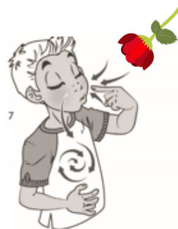
1 INSPIRE LA FLEUR