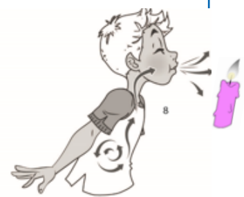
2. SOUFFLE LA BOUGIE